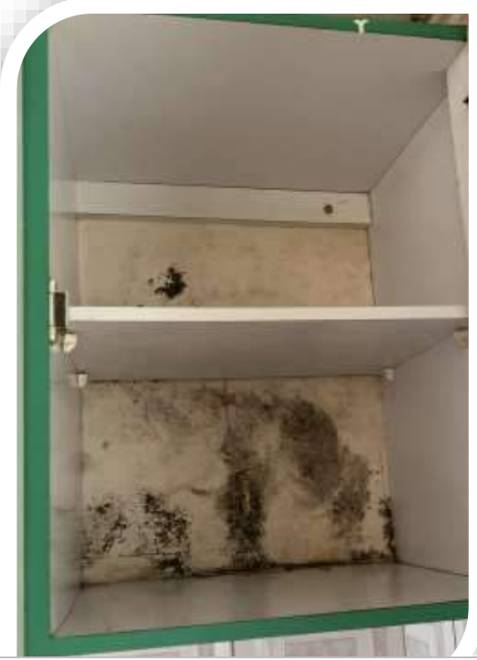
FOTO No. 5 Ganinete superior