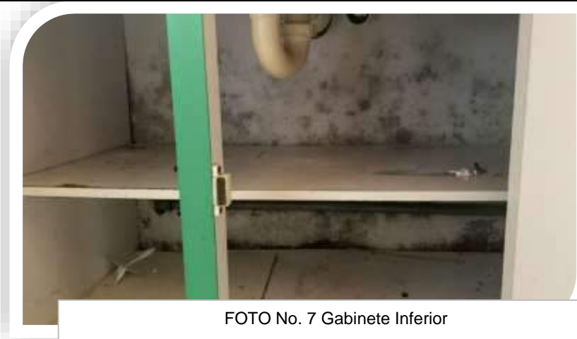
FOTO No. 7 Gabinete Inferior

En atención a la orden de trabajo 20245840010183 del dieciocho (18) de Agosto del 2024, el cual hace parte integral el Expediente No. 2024584490100576E de 2024 de la INSPECCIÓN OCTAVA “G” DISTRITAL DE POLICÍA de la ALCALDIA LOCAL DE KENNEDY , se realiza visita técnica mediante un registro fotográfico y ocular al predio localizado en la LOCALIZACIÓN DE PREDIO Calle 6 N.o 80b-89 T7 interior 1 apto 403 y 503 Direcciones que corresponde al querellante y al querellado, con el fin de conceptuar los siguientes aspectos: