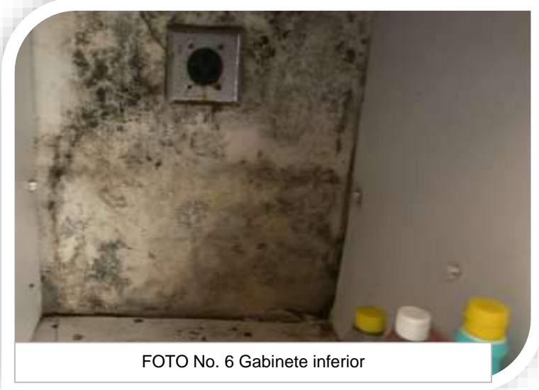
FOTO No. 6 Gabinete inferior